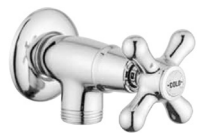
Rubinetti - Newport - RB057 - RB058