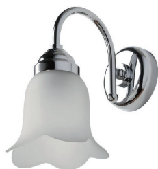
Illuminazione - Shelly - APGI02