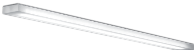
Illuminazione - Minima - LED1